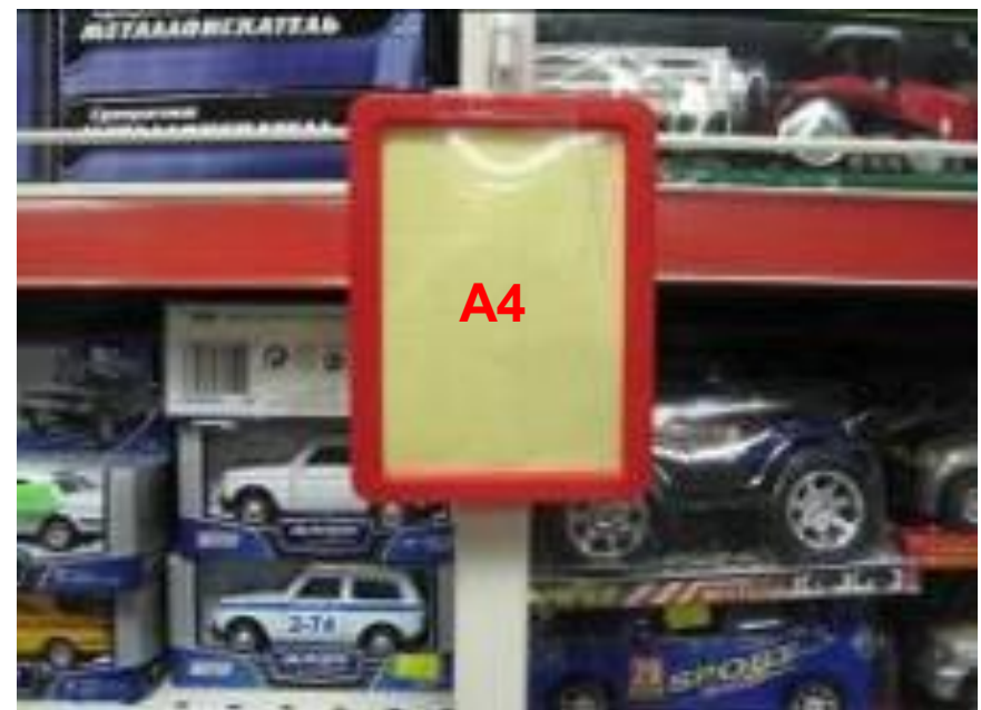
• Плакат А4